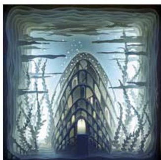
Deep Atlantis (collection privée) Cut Out 3D & Light box, 50 x 50 x 12 cm, 2020

À visiter son atelier - sur rdv- ou son web-site www.radustefanpoleac.com