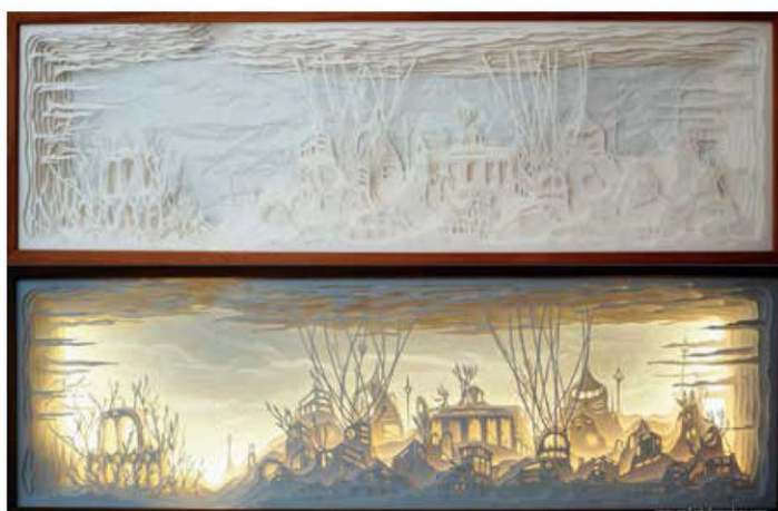
Le temple de lumière (collection privée), Cut Out 3D & Light box, 50 x 150 x 12 cm, 2021 Lumière éteinte, en haut et allumé en bas