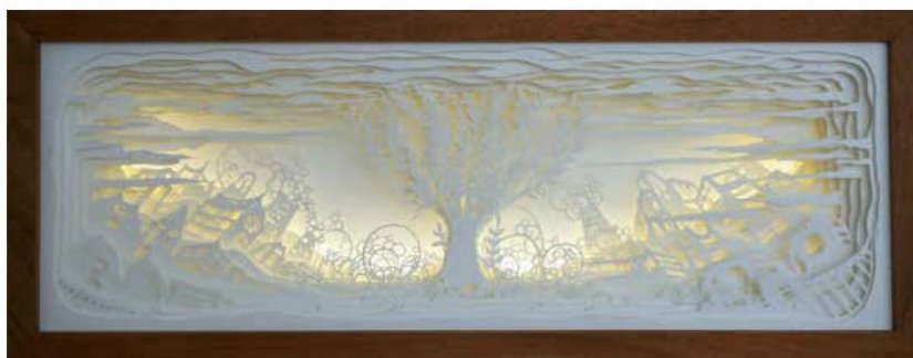
Tree is Life , Cut Out 3D & Light box, 35 x 90 x 12 cm, 2021